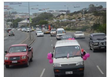
Autocorso durch Port Moresby