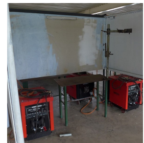
Dank Spendengeldern können die Elektrodenschweißgeräte wieder sicher bedient werden

genstände und Ersatzteile für die Schweiß Maschinen kaufen: Schweiß Handschuhe, einen Winkelschleifer mit Ersatzschleifscheiben, neue Kabel und Klemmen für die Schweiß Maschinen, Schweiß Schilde und Schweiß Helme. Schon einmal vorab ein herzlichstes Dankeschön allen Spenderinnen und Spendern aus Deutschland und der Schweiz.