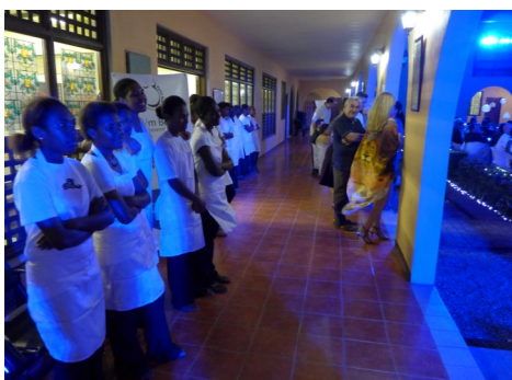
Die Internatsfreuen von DBTI hören erstmals Operngesänge live.