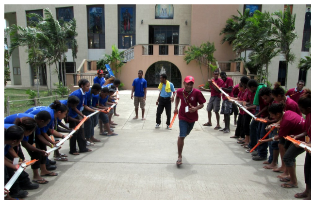
Vollen Einsatz bei den Gruppenspielen!

„Connected. Moving On.“ - Miteinander verbunden. Gemeinsam auf dem Weg. (Motto des Jugendlagers)