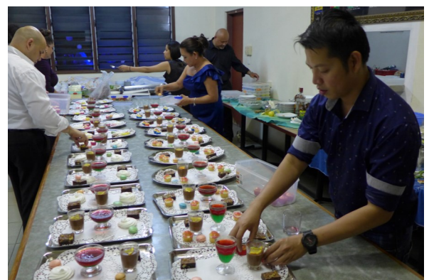
Feinste Nachspeisen werden für die rund 200 Gäste vorbereitet

"Karim Belle" - die Mutter-Kind Gruppe, die der Entbindungs-Station des Allgemeinen Krankenhauses von Port Moresby angegliedert ist.