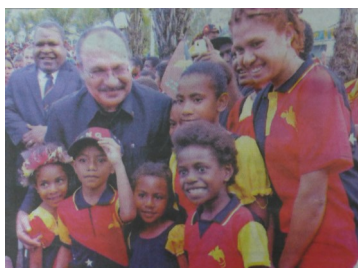
Ministerpräsident O'Neill posiert mit Jugendlichen nach dem Aufzug der Flagge

„Arise! All you sons of this land!“ (Steht auf! All ihr Söhne dieses Landes!) Am 16. September erschallte dieser Satz aus der Nationalhymne in PNG an verschiedensten Orten. Die Feierlichkeiten waren außer in Mount Hagen im Hochland von Papua Neuguinea friedlich. Dort hielten sich ausländische Geschäftsleute nicht an den nationalen Feiertag. Als Folge wurden ihre Geschäfte geplündert. Der Ministerprä-