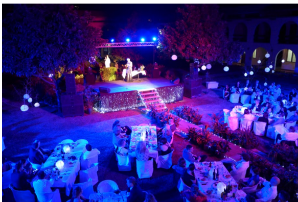
Die vornehmen Damen und Herren speisen gediegen im Innenhof des Konferenzentrums Emmaus und lassen sich verwöhnen durch Operngesänge