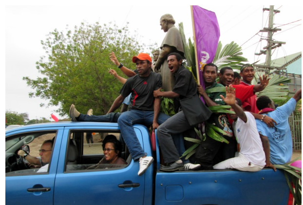
Don Bosco auf Reisen: Quer durch die Hauptstadt Port Moresby!