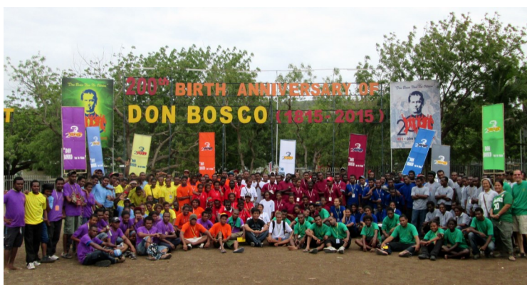
Die gut 200 Teilnehmer/innen vom Jugendlager „Wan Tok Bosco“ sind sehr dankbar um Ihre, um eure Unterstützung auf welche Art auch immer.

https://www.dropbox.com/sh/1szgktdr3nxlhh/FxfFZJ_FwY