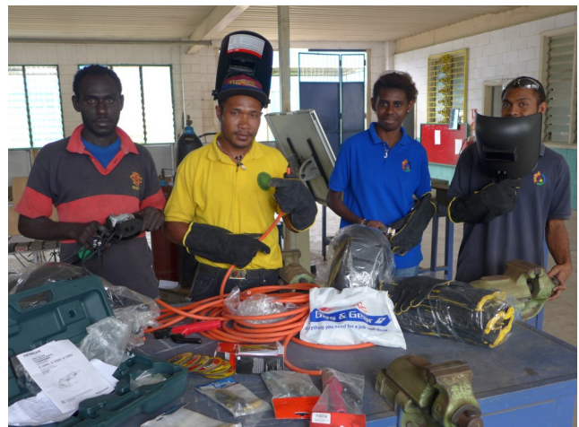
Die vier Praktikanten /in präsentieren voller Freude die neuen Ausrüstungsgegenstände für die Schweißwerkstatt

In diesem Rundbrief werde ich über ein besonderes Benefizkonzert berichten. Ein Jugendlager ganz im Sinne Don Boscos steht im Zentrum. Eine besondere Ehre war dabei der Besuch des Regionalobern der East Asia—Oceania Region Father Vaclav Klement. Auch findet ein Bericht über den 39. Unabhängigkeitstag von Papua Neuguinea platz. Viel Vergnügen beim Lesen!