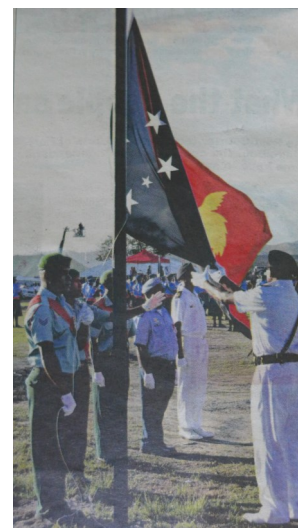
Einholen der Flagge

Sir Michael Ogio sagte: „Wir reduzierten die Größe von Papua Neuguinea durch unsere Gier und Selbstsucht. Was einst unsere Leidenschaft war für PNG zu Leben und zu Sterben hat sich gewandelt zu der Leidenschaft zu Leben und zu Sterben für seine eigenen Interessen.“