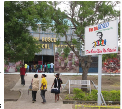
Rund 200 Jugendliche strömen am Freitag in die Sporthalle bei DBTI

Um 18 Uhr beten wir gemeinsam den Rosenkranz. 50 Personen stellen sich in einem Kreis auf. Jede/r sagt ein „Gegrüßet seist du Maria“. So werden viele Stimmen gehört. Beim Abendbrot ist das Reis warm und es gibt gutes „Geschnätztes“ an Currysauce. Am Abend wird das Don Bosco Rollenspiel erstmals aufgeführt.