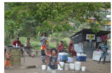
Viele Passanten winken am Straßenrand und freuen sich über den speziellen Umzug