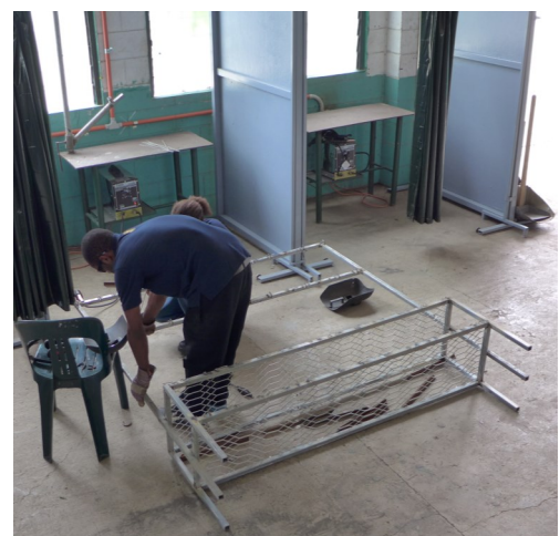
Garderobe für die Computerlabore in Arbeit