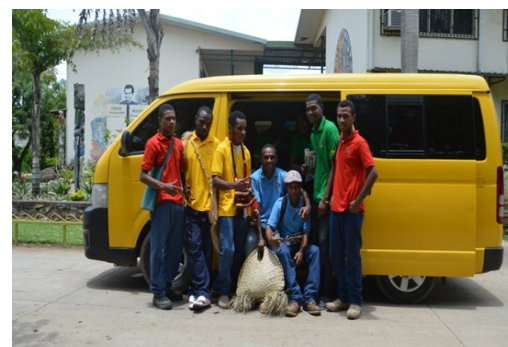
Einer der beiden neuen Schulbusse für DBTI

Von Montag bis Freitag werden täglich rund 130 Tages-Studenten/innen von verschiedenen Sammelpunkten in Port Moresby am Morgen abgeholt und am Abend wieder dorthin zurückgebracht. Die beiden Schulbusse haben insgesamt 32 Sitzplätze.