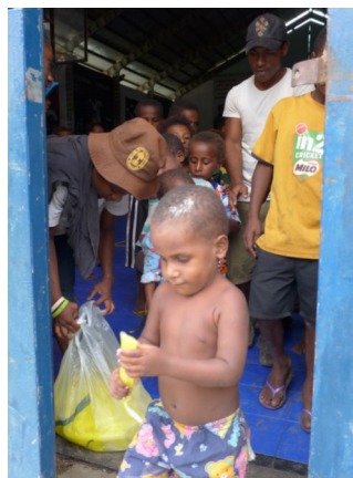
Ein Eis vom Oratorium für auf den Heimweg