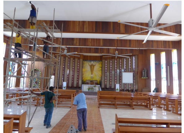
Neue Decken-Ventilatoren für die Kirche bei DBTI

Die Stimmung an der Schule ist gut und wir haben nicht zu klagen.