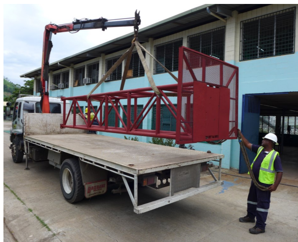
Der Antennenturm wird vom Kunden in Empfang genommen