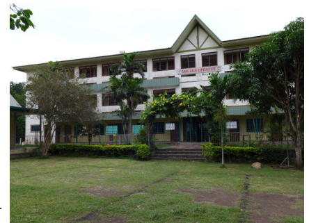
Vom Savio-Haus wieder zurück zum

Neben der Vorstellung der Mitbrüdergemeinschaften