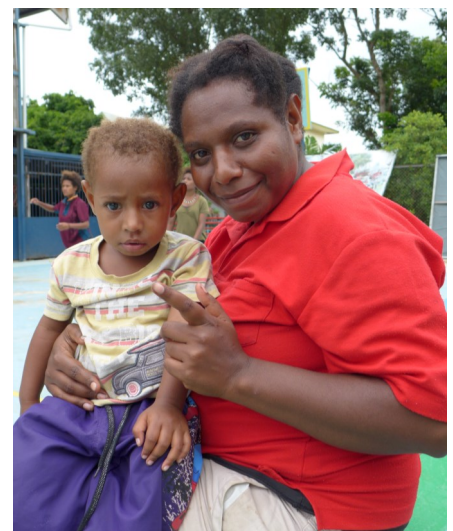
Familie, die ins Sonntagsoratorium zu DBTI kommt

https://www.dropbox.com/sh/1szgktdr3nxlhh/EfxFZJ_FwY