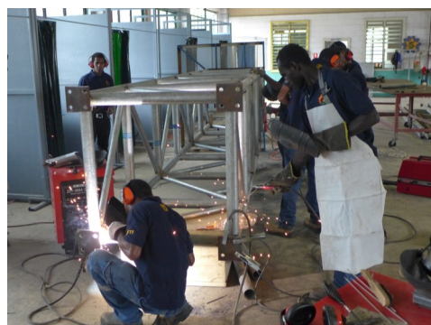
Großprojekt: ein Antennenturm im Auftrag des Kunden

Ich wünsche allen viel Freude beim Lesen.