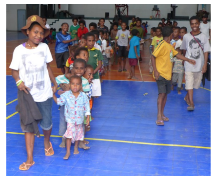
Das Sonntagsoratorium bei DBTI ist wieder offen!