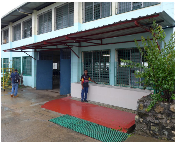
Neuer Hand-Waschbereich für die Schweiß Werkstatt, inklusive selbstgebautem Vordach