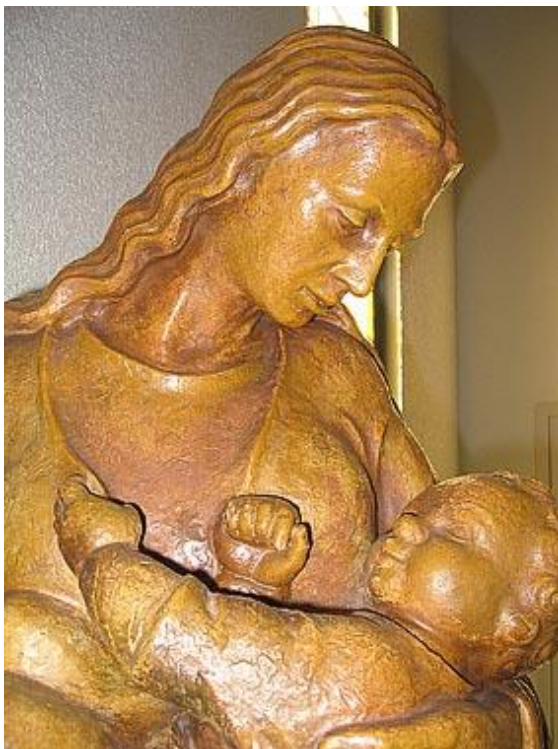
Maria mit Jesuskind (Gips-Plastik)