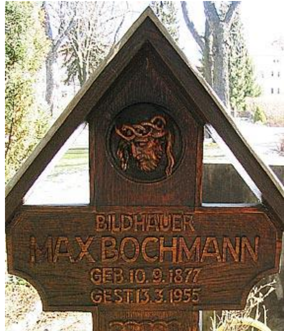
Bochmanns Grabstein auf dem Andreas-Friedhof

Weg aus der Werkstatt in die Herzen der Menschen gefunden haben und dort unsterblich sind.