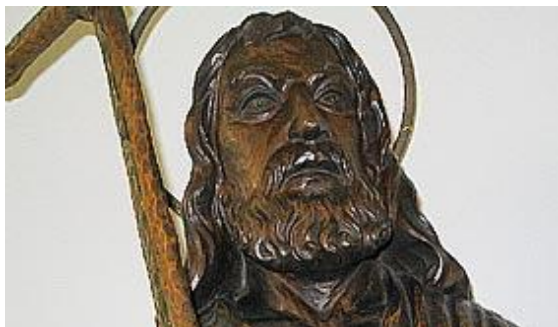
Johannes der Täufer

„Kehrt um! Denn das Himmelreich ist nahe.“ – Matthäus 3,2