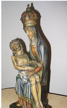
Abbild: Maria-Telgte b. Münster

Aufbewahrt wird sie zur Zeit in einem Schrank. Zu hoffen bleibt, dass diese schöne Plastik eines Tages ihren Platz in der Antonius-Kirche finden wird.